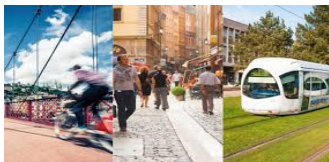
La mobilité & le transport Intermodalité, transports doux et partagés

Les productions renouvelables & citoyennes Énergie locale et démocratique