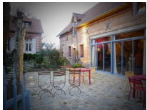
L'urbanisme & le bâti Aménagement durable du territoire Rénovation et maîtrise de l'énergie

Les pratiques agricoles & l'alimentation Produire et se nourrir localement, au bénéfice des producteurs et du milieu naturel