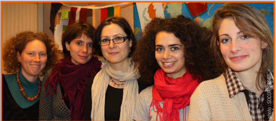
Une équipe de bénévoles motivés et engagés

Sénois est accréditée structure d'envoi, d'accueil et de coordination de SVE. Elle est également « Relais local d'information sur le PEJA ». « Cette année, par exemple, 16 jeunes ont pu partir pour des projets et chantiers en Allemagne, en Arménie, en Macédoine, en Hongrie... 5 autres volontaires se sont impliqués dans un échange de jeunes en Turquie sur l'éco-tourisme, relate la co-présidente. Mais nous avons aussi accompagné deux initiatives au niveau local. La première contre les discri-